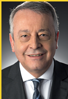
Antoine Frérot, Președinte Director General al Veolia

P este tot in lume unde functioneaza, Grupul Veolia acorda o atentie sporita promovarii valorilor sale fundamentale, in armonie cu «Scopul Nostru» adoptat in data de 18 aprilie 2019, acorda o atentie deosebita legislatiei proprii fiecarei tari si regulilor de conduita adoptate de organisme internationale, astfel pentru a adera la acestea.